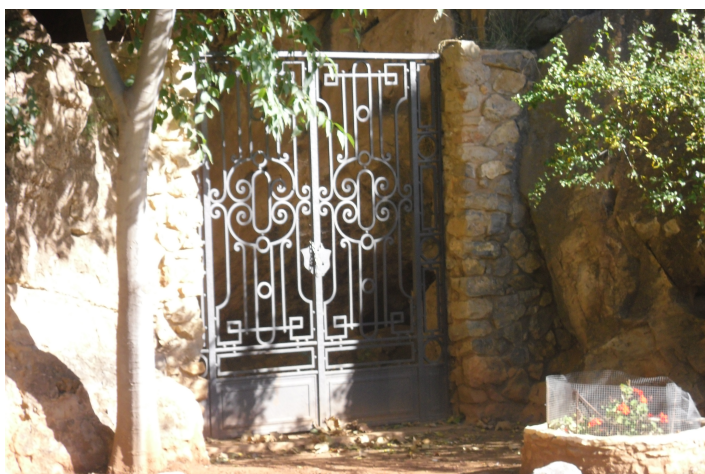
Porta exterior de la cova.

Està situada en el Paratge de Sant Josep, al costat de la mateixa Cova de Sant Josep, Can Ballester i La Cova, totes elles amb restes d'ocupacions humanes des de la Prehistòria. Aquest conjunt de coves i tot el seu entorn, conegut com a "Paratge de Sant Josep" constitueixen un element fonamental dins del municipi per diverses raons: d'una banda perquè es tracta d'un espai natural de gran riquesa i perquè el conjunt de coves, una d'elles travessada pel riu de Sant Josep, han suposat el lloc d'hàbitat per a les poblacions prehistòriques.