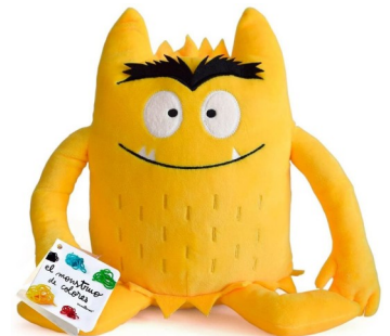
El Monstruo de Colores , de Anna Llenas