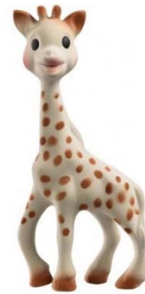
Sophie, la jirafa

Después de diez minutos de entusiasmo compartido, acabo siempre en el suelo o en la jaula de colores que comparto con otros animales y vehículos. “Llevamos una vida perra”, suele decir Chase, el compañero de la Patrulla Canina. No le falta razón. No es fácil ser una jirafa de juguete en el aula de Infantil.