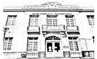
MUSEO DE LA REVOLUCIÓN