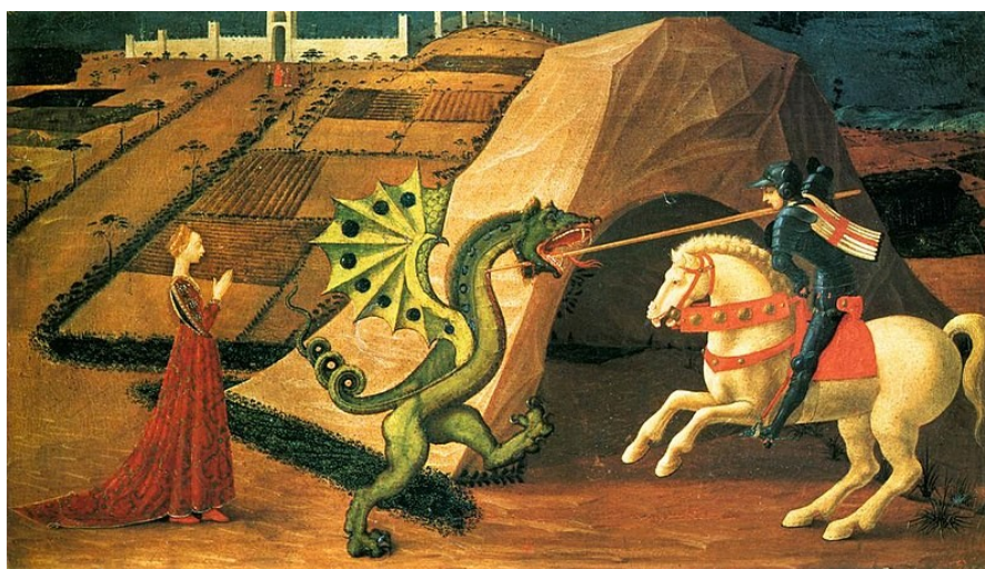
Leyenda de San Jorge y el dragón. Paolo Uccello. (1456-1460)

Sumado a lo anterior, es importante destacar el papel que por ejemplo la cultura cristiana ha tenido en la historia de los dragones. Particularmente, podemos leer en la biblia que se hace referencia a estos animales en algunos pasajes de este texto, lo que sin duda ha contribuido a promover la creencia de su existencia.