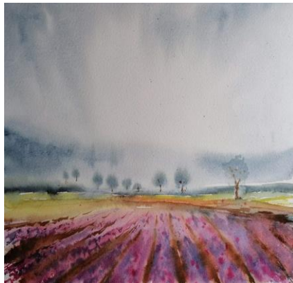
Campos de lavanda

Actualmente, junto con otros compañeros de la Agrupación formamos el Grupo de Arte Gru-Gru.