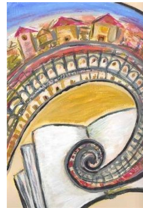
Concurso de investigación y memorias 2021