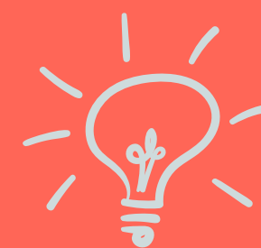
Lo que creas relevante