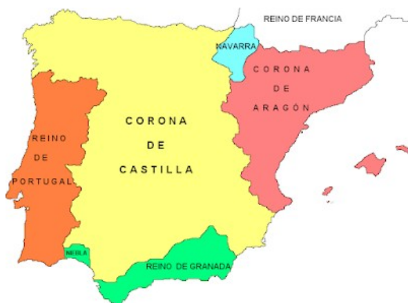
La península Ibèrica al voltant del 1250

La vida dels mudèjars 10 de la Vall realment no va variar malgrat produir-se la conquesta cristiana dels territoris. Van conservar la pràctica de l'Islam dins d'una societat cristiana, que en els primers temps del nou Regne de València era exercida públicament i amb llibertat, gràcies a una sèrie de pactes que la població sarraïna sotmesa estipulà amb el conqueridor, com per exemple, les cartes pobles.