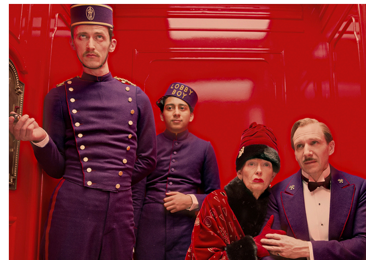
Gran Hotel Budapest